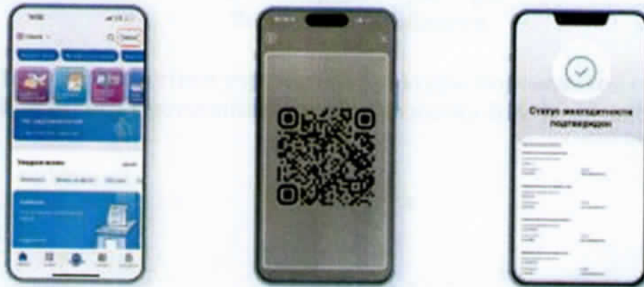
Рис. 3 - Экран проверяющего.

2.4. При успешно выполненной проверке, указанной в пункте 2.3, проверяющий принимает положительное решение о предоставлении услуги.