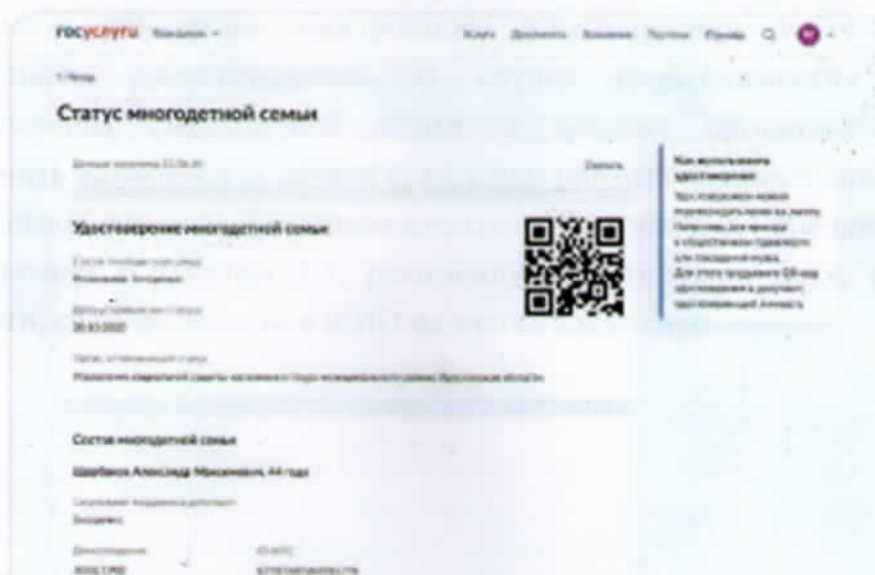
Рис. 2 - Web-версия электронного удостоверения на ЕПГУ.

2.3. Проверяющий с использованием раздела «Госкан» мобильного приложения ЕПГУ (после авторизации с использованием единой системы идентификации и аутентификации) осуществляет считывание QR-кода, переход по которому подтверждает актуальность статуса многодетной семьи в момент проверки, а также соответствие фамилии, имени, отчества с данными документа, удостоверяющего личность. При необходимости проверяющий вносит сведения электронного удостоверения многодетной семьи во внутреннюю систему